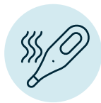
Fiebre alta (puede alcanzar más de 40 °C)

Usted se puede enfermar de 7 a 14 días después de estar cerca de una persona con sarampión.