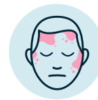
Sarpullido (aparece de 3 a 5 días después de sentirse enfermo)