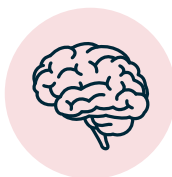
Inflamación del cerebro (encefalitis)