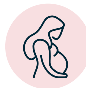
Problemas durante el embarazo*