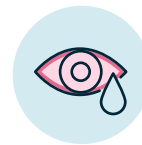
Ojos rojos o llorosos