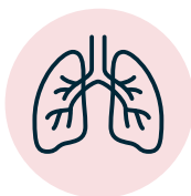
Infección en los pulmones (neumonía)

El sarampión puede causar problemas graves de salud como: